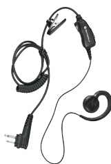
Auricular giratorio con micrófono integrado y PTT