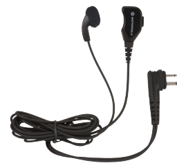
Auricular con micrófono integrado y PTT

Las radios de la serie XT600d son compatibles con los accesorios de la serie XT400, a excepción de la pinza para transporte y de la funda de cuero.