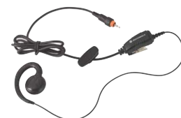
Auricolare con pulsante PTT in linea

Questo rivoluzionario design pulito consente di ricaricare rapidamente la radio Motorola CLP. Un caricatore multi-unità offre la possibilità di ricaricare comodamente fino a sei CLP Motorola simultaneamente. Il caricatore è dotato di una tasca posteriore per contenere l'auricolare mentre l'unità è sotto carica e può essere montato al muro ove vi siano problemi di spazio.