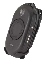
Fondina per cintura girevole