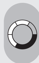
Nivel de volumen 8