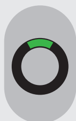
Nivel alto de batería