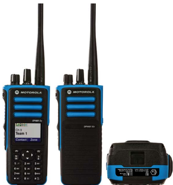
DP4801 Ex (Displej) DP4401 Ex (Bez displeje)

DP4801 Ex - Lze přidat plnou klávesnici a velký barevný displej pro přístup k pokročilým funkcím, např. posílání textových zpráv a zobrazení jména volajícího